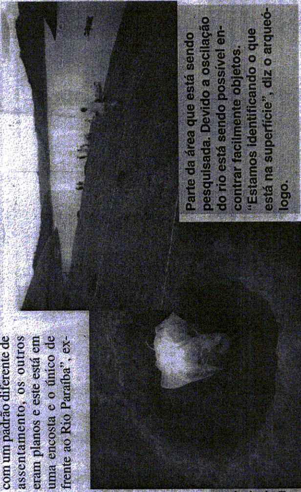
Parte da área que está sendo pesquisada. Devido a oscilação do rio está sendo possível encontrar facilmente objetos. "Estamos identificando o que está na superfície", diz o arqueólogo.

As pesquisas estão sendo patrocinadas pela Light, que investiu, nesta primeira etapa, cerca de R$7000, a previsão entra com a mão-de-obra em uma equipe de seis pesquisadores.